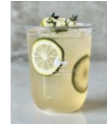
Honey Lemon ハニーレモン 660yen