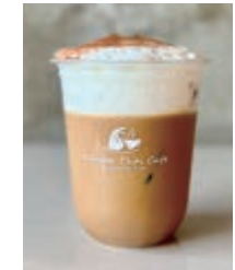
Cappuccino/Hot or Ice カプチーノ 660yen