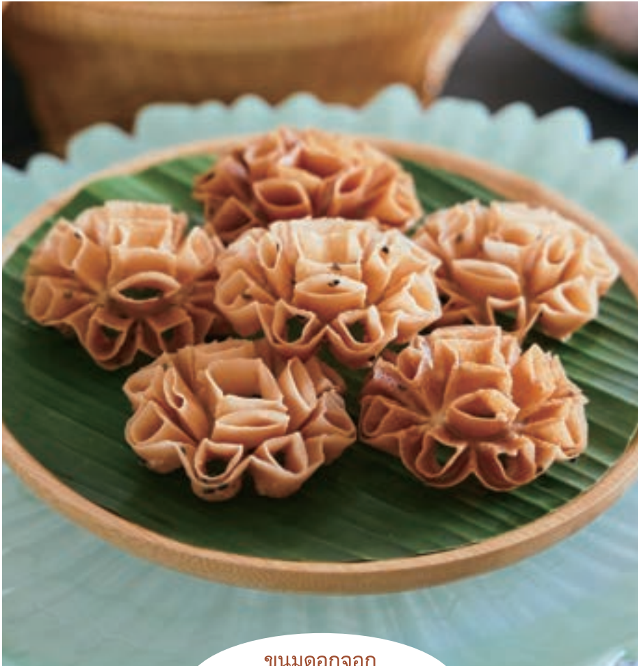
ขนมดอกจอก

Kanom Doc Jok /ロータスフロッサム クリスピークッキー 1piece 200yen/3piece pack 550yen(テイクアウト)