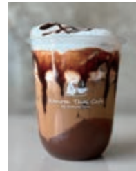
Cafe Mocha/Hot or Ice カフェ モカ 660yen