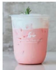
Pink Milk ピンクミルク 550yen