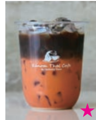
Thai Tea Coffee タイティーコーヒー 660yen