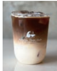
Cafe Latte/Hot or Ice カフェ ラテ 660yen