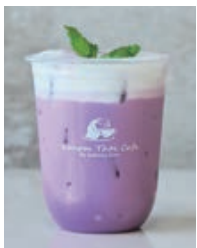
Taro Milk タロミルク 660yen