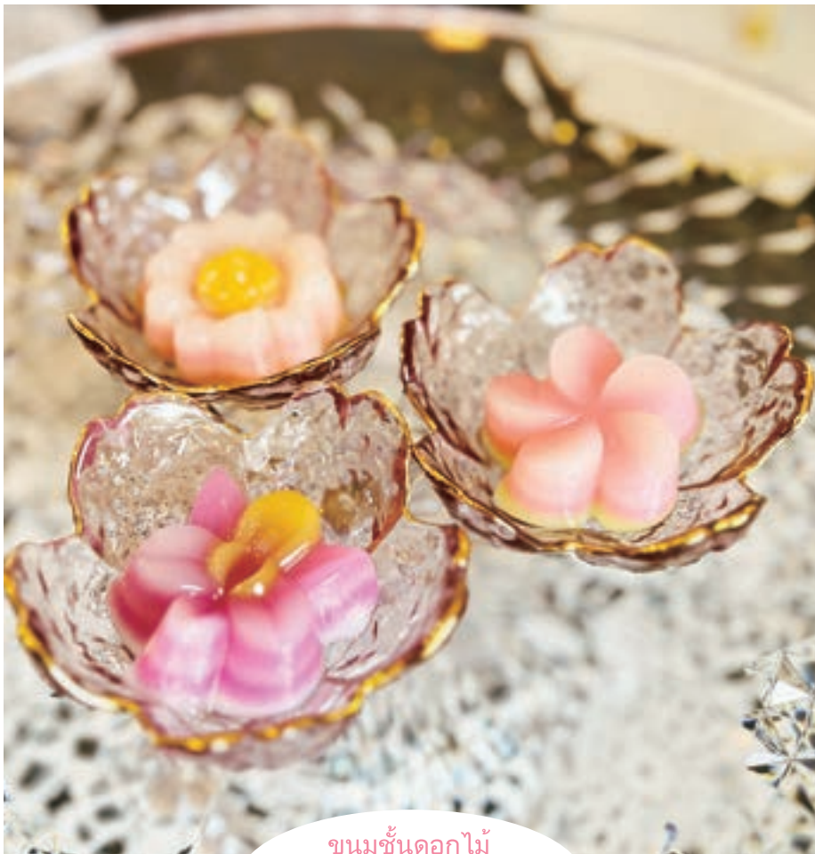
ขนมชั้นดอกไม้

Kanom Chan/カノム チャン(レイヤースイートケーキ) 1piece 250yen