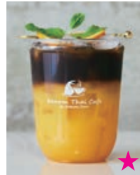
Orange Coffee オレンジコーヒー 720yen