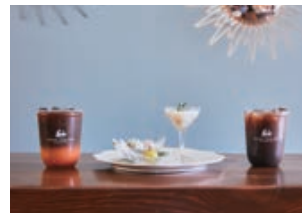
Drink & Sweets Set ドリンク & スイーツセット 910yen〜

その日にご用意しているタイスイーツとドリンクを 一緒にお召し上がりいただくセットメニュー。 スイーツ2種類もしくは3種類でご提供します。