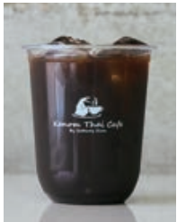
Americano/Hot or Ice カフェ アメリカノ 550yen