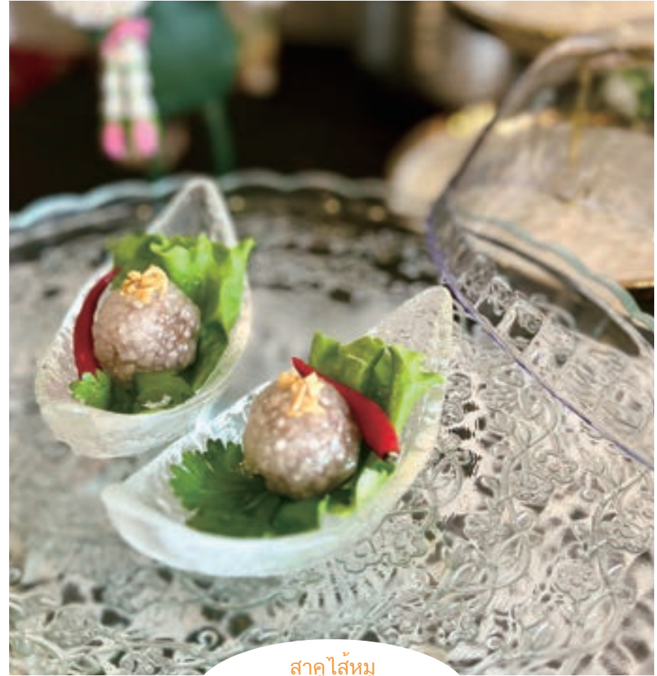
สาकुไส้หมู

緑豆のペーストにココナッツミルクを加え、ゼリーコーティングで本物のフルーツのようにアレンジしたスイーツ。タイ語名は[カノム ルークチュープ]。