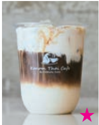
Cream Cheese Latte クリームチーズ ラテ 720yen