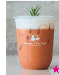
Thai Tea タイミルクティー 660yen