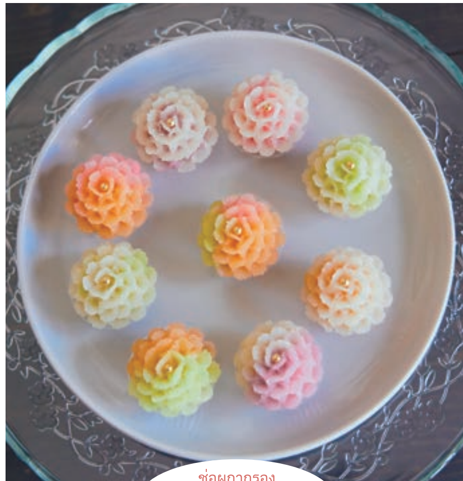
ช่อพกากรอง

卵の黄身だけをホイップクリーム状にし、加熱したシロップでゆっくりボイル。 常温で冷ましたあと、小さな器に入れて花の形に整えたお菓子です。 タイでは慶事に作って食べる習慣があります。