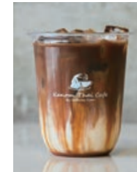
Caramel Macchiato/Hot or Ice キャラメル マキアート 660yen