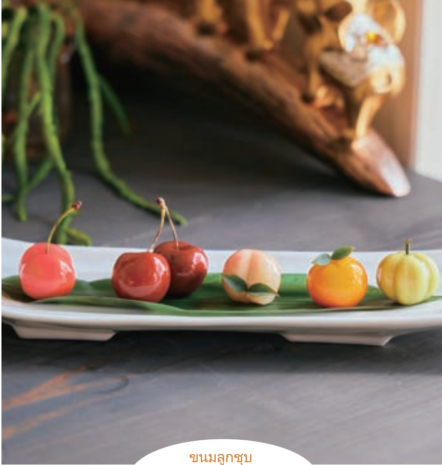
ขนมลูกชุบ